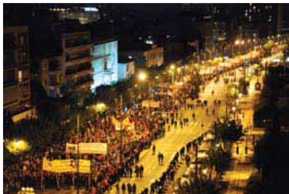
Фото с демонстрации в Афинах 17 ноября 2009г. Силы КПГ и КМГ проходят у стен американского посольства

К ПГ на 18ом съезде сконцентрировала свое внимание на многообразной идеологической, политической, массовой борьбе на почве непосредственных и прямых рабочих, крестьянских и в целом народных проблем. Партия считает, что авангардная работа, которую она проводит, не будет достаточной для развития политического сознания рабочего класса и народных слоев, если она не будет способствовать осознанию того, что ежедневная борьба должна идти в направлении борьбы за свержение