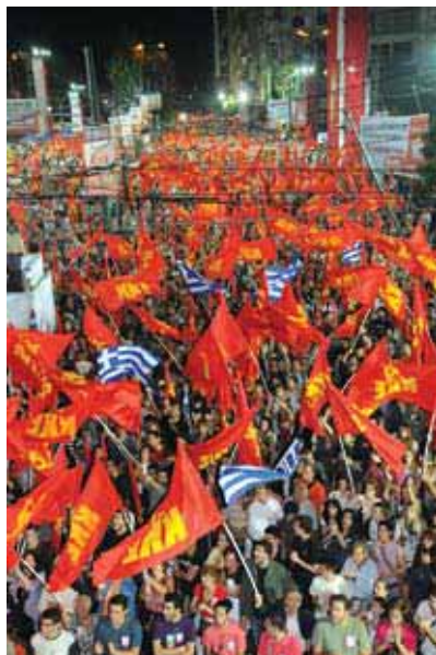
Фотографии с центрального предвыборного митинга КПГ в Афинах

Критерии, по которым КПГ рассматривала результаты выборов, привели партию к оценке, что «укрепление КПГ не достигается теми условиями и методами, которые требуются для буржуазных партий или других партий, выражающих мелкобуржуазные, оппортунистические представления». Исходя из этого, КПГ не абсолютизирует результаты выборов и избирательного боя. Она, прежде всего, ставит перед собой задачи, которые касаются деятельности в рабочем движении, прогресса партийного строительства, влияния в молодежном движении, повышения уровня идеологического и политического созревания, преданности борьбе и перспективе.