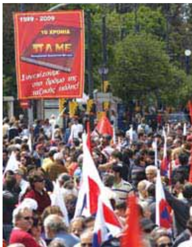
Фото с первомайского митинга ПАМЕ в Афинах, на площади «Синтагма» (у стен греческого парламента), 2009 г.

10 лет тому назад, в 1999г, по инициативе КПГ силы профсоюзного движения, признающие необходимость классовой борьбы, сформировали Всерабочий боевой фронт (ПАМЕ). На центральном плакате с информацией о десятилетней деятельности ПАМЕ (1999-2009г.г), начерчен лозунг: «Продолжаем путь классовой борьбы».