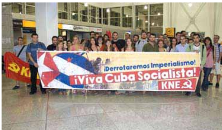
Бригада Коммунистической молодежи Греции (КНЕ) отправляется на Кубу

К ПГ и КМГ в течение всего года проводят десятки мероприятий солидарности с социалистической Кубой. Как отметила в октябре 2009 года Алека Папарига – Генсек ЦК КПГ, в связи с исполнением 47 лет со дня установления экономической, торговой и финансовой блокады Кубы со стороны США, «КПГ выражает свою безграничную солидарность и поддержку народу и Коммунистической партии Кубы. Всенародное требование отмены блокады становится результативным в сочетании с борьбой против империализма и открытых или прикрытых подрывных планов, а также с борьбой против наступательности ЕС, которой следуют европейские правительства, в том числе и греческое. Защита социалистической Кубы и борьба против блокады являются одновременно защитой права нашего народа на борьбу против «безальтернативных путей развития», против яра эксплуатации, за другой путь развития, в эпицентре которого находится удовлетворение народных потребностей»