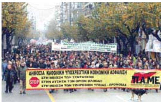
Фото с демонстрации ПАМЕ. Основное требование- государственное, всеобщее, обязательное социальное страхование

политические силы, управленцы системы беспокоятся за свою политическую стабильность, видя реальную опасность потерять контроль над событиями, порожденными последствиями кризиса. Однако то, что для буржуазии представляет опасность экономической и политической дестабилизации, для рабочих народных сил является надеждой.