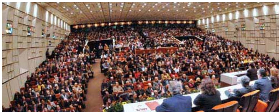
Фото с 18-го съезда КПГ, который прошел в феврале 2009 года в зале съездов здания ЦК партии

18ый съезд КПГ вооружил всю партию значительными резолюциями о реорганизации рабочего движения, партийном строительстве, идейно - политической работе, для продвижения общественно-политического союза рабочего класса и народных слоев города и деревни. Важной опорой в этом направлении является Резолюция 18-го съезда КПГ о социалистическом строительстве в СССР в 20ом веке и концепции КПГ о социализме.