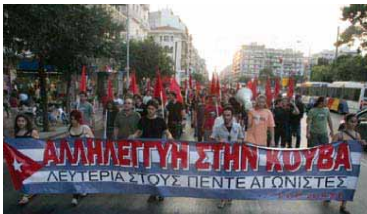
Демонстрация солидарности с Кубой, требованием которой является освобождение 5 кубинских патриотов из американской тюрьмы, организованная Партийной Организацией Салоник Коммунистической партии Греции