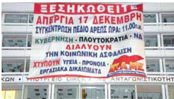
Фото захвата министерства финансов Греции, который провели силы ПАМЕ в центре Афин, с целью пропагандировать забастовку, объявленную ПАМЕ на 17 декабря 2009 года.