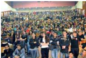
Выступление КМГ в амфитеатре афинского государственного политехнического университета по вопросам социализма

в Афинах 22 июня 2009 года (вторая фотография).